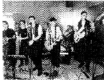
Feelings, vendredi soir à la cave.

Le samedi 16 mai 1997, le Jazz-Club Moulinois propose, vendredi soir, une incursion dans le Rythm'n blues avec des jeunes de l'école de musique et leur formation Feelings.